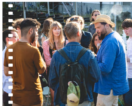
Talanger pratar med regissören Goran Kapetanović under Bergmanveckan på Fårö.

Film Stockholm och Film på Gotland har skapat ett forum där deltagarna i de två regionernas talangprogram får möjlighet att mötas i gemensamma aktiviteter under Bergmanveckan på Fårö samt Stockholms filmfestival.