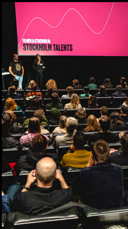
MIKAEL STRÖM JUPITERFILM STOCKHOLM