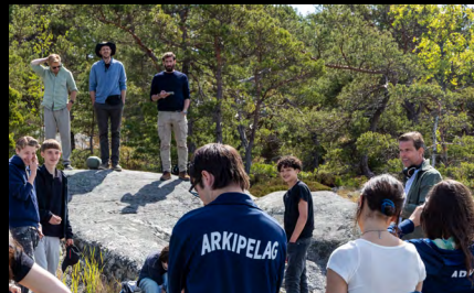
MIKAEL STRÖM JUPITERFILM STOCKHOLM

Under 2025 spelas fler än tio produktioner in i Stockholm med Film Stockholm som samproducent. Inspelningsmiljöerna skiftar från innerstad till kringkommuner till landsbygd och skärgård.