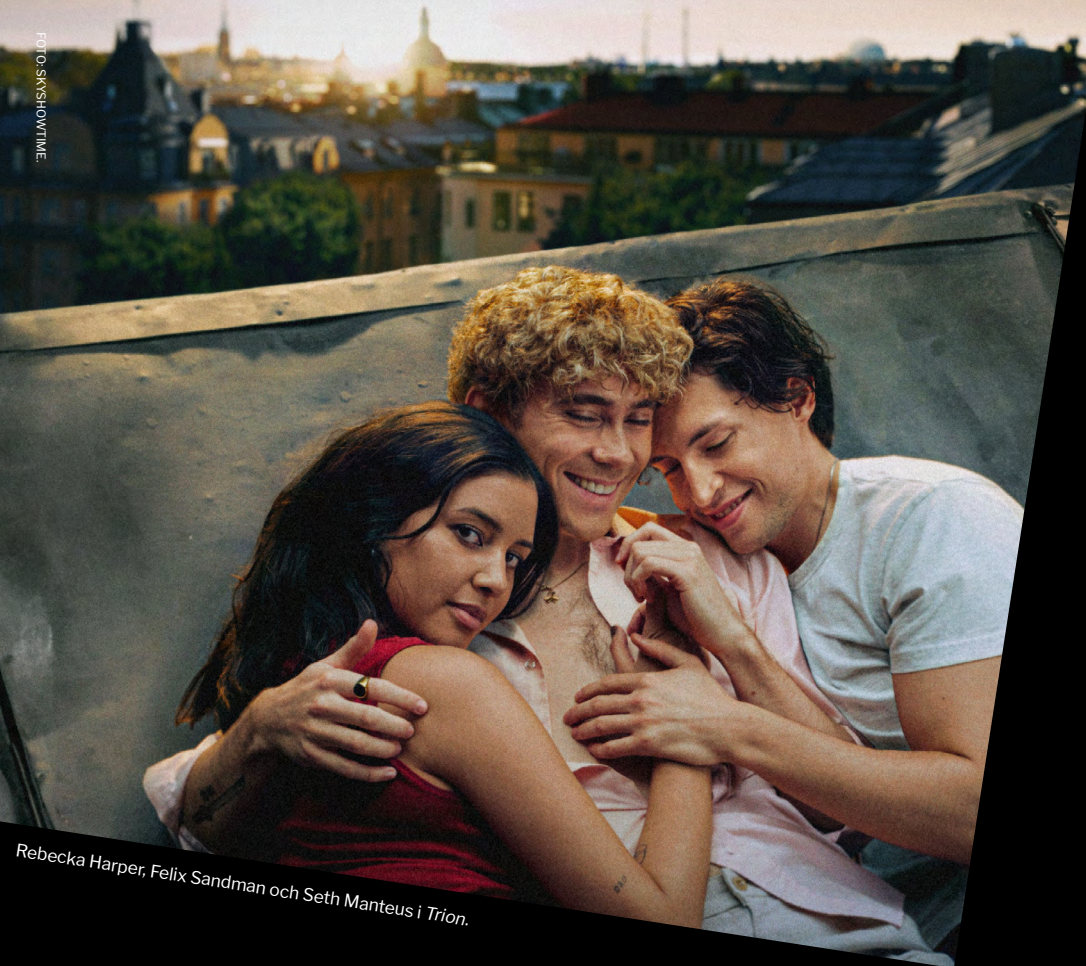
Rebecka Harper, Felix Sandman och Seth Manteus i Trion .