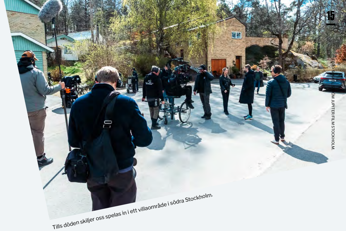
Tills döden skiljer oss spelas in i ett villaområde i södra Stockholm.

Samtidigt finns ett tydligt medborgarperspektiv. Fungerande inspelningar minskar störningar i vardagen, samtidigt som produktionerna bidrar till lokala arbetstillfällen, ökad synlighet för platser i regionen och ett levande kulturliv.