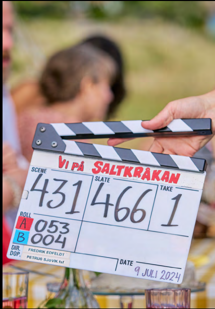
Vi på Saltkråkan spelas in i Stockholms skärgård 2024.

En uthyrningsguide för platsägare och andra som tar emot en filminspelning eller tv-produktion lanseras tillsammans med Nationella produktionsnätverket.