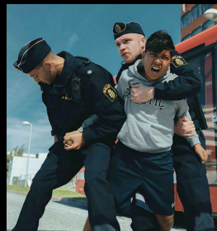
Bullets var en av de första samproduktionerna som spelades in.

Film Stockholm inleder en regional samverkan med Film på Gotland och Gotlands Filmfond inom talangområdet, filmkommission och samproduktion. Ansökningar till Gotlands Filmfond görs genom Film Stockholms ansökningsportal och handläggs av Film Stockholm.